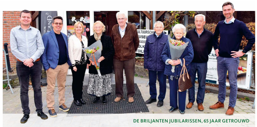
DE BRILJANTEN JUBILARISSEN, 65 JAAR GETROUWD

Ook de koppels die 25 jaar getrouwd zijn, mochten klinken op nog meer liefdevolle jaren. 27 enthousiaste koppels genoten van een hapje, drankje en een quiz.