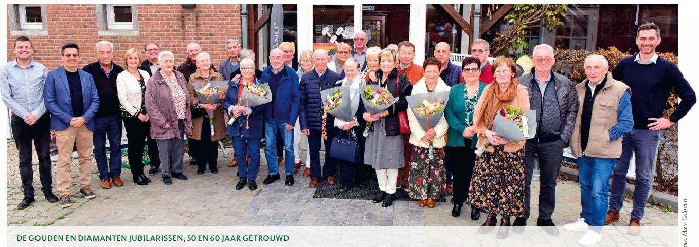
DE GOUDEN EN DIAMANTEN JUBILARISSEN, 50 EN 60 JAAR GETROUWD