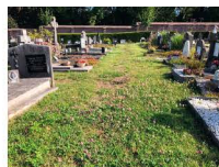
Veraangenamen plekje voor sterrekindjes met een meerstammig boompje en vaste planten